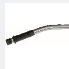
ホースペント チューブ 46691