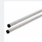
エクステンション チューブ×2本 107408074