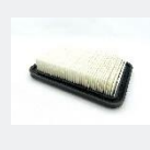
フラットフィル ターMクラス 107413540