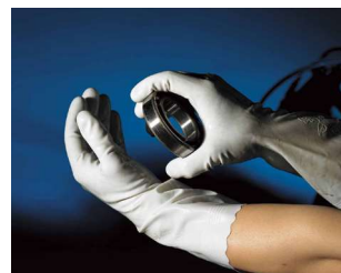
ビニトップ® 薄手 No.130