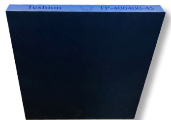
<チャコールフィルター>