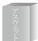
アスウェット15原液