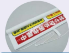
表 石綿封じ込め等作業中 ウラ 石綿除去作業中