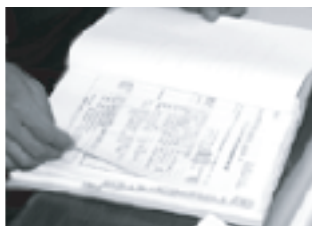
膨大な施工記録集。このように蓄積されたデータが仕事の棲み分け時に活用されています。

また所属するメンバーは、分析や除去工事、コンサルティングなど得意とする専門分野が違うためどうしても格差があります。こうした問題解決のため、月に勉強会を開いて会員間のレベルアップを図ってきたおかげで、最近この会から石綿協会認定のインストラクターが誕生しました。第二、第三のインストラクターが生まれることで、さらにこの会のグレードが向上できればと思っています。