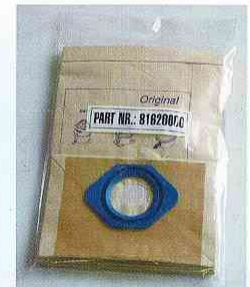
ダストパック (5枚入り)